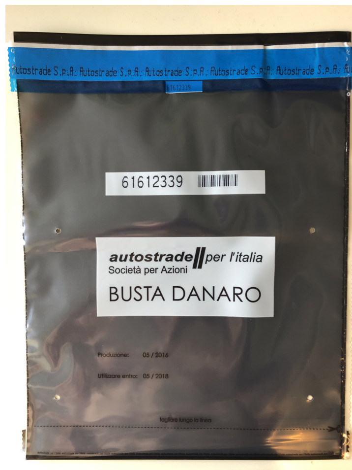
busta denaro (formato grande)

Si precisa infine che, qualora dovessero rendersi necessarie modifiche relative alla grafica delle borse denaro o alle località di consegna, non saranno riconosciute maggiorazioni di prezzo: ogni eventuale ulteriore onere deve intendersi a carico della Contraente.